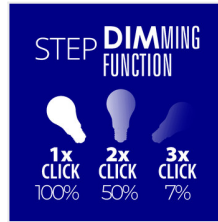
XLED A60 7W-STEPDIM