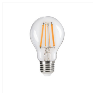
XLED A60 7W-STEPDIM